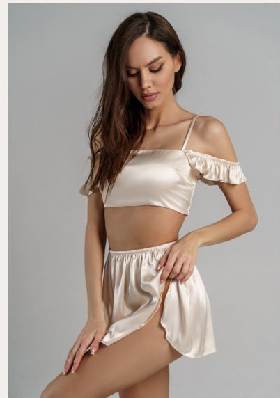
Комплекты с юбкой